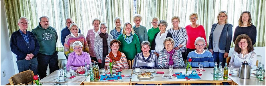
Die fleißigen Gemeindebriefverteiler*Innen u. der Redaktionskreis beim geselligen Beisammensein.