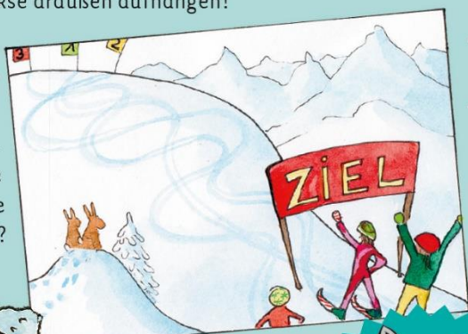
Der Skifahrer mit der Startnummer 1.

Rätsel: Wer ist im Rennen die kürzeste Strecke gefahren?