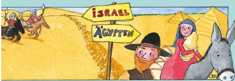
Auflösung: Ein Engel.

aus der christlichen Kinderzeitschrift Benjamin